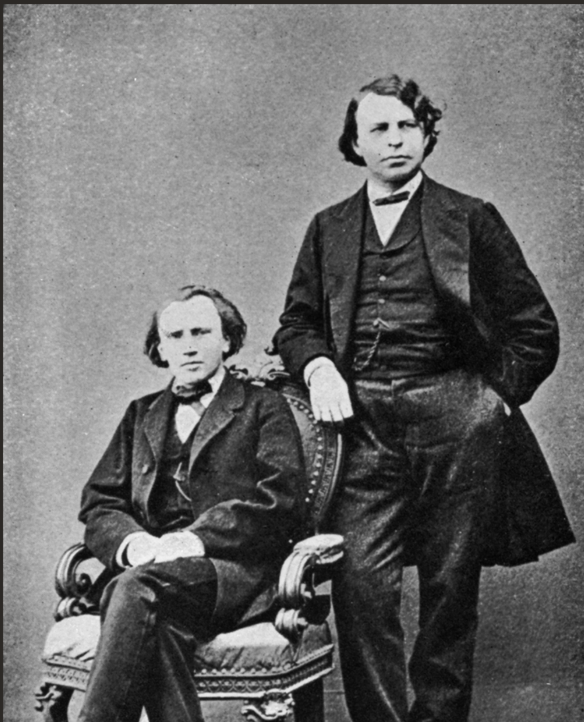
Brahms con su amigo Joseph Joachim