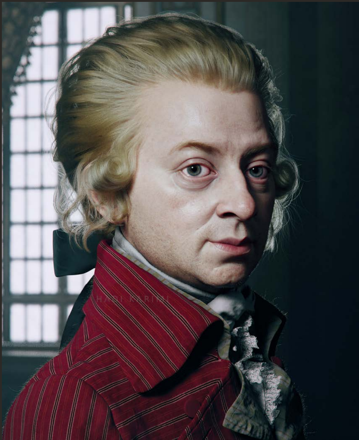
W.A. Mozart, Modelado digital en 3D a partir de fotografías. Obra de Hadi Karimi